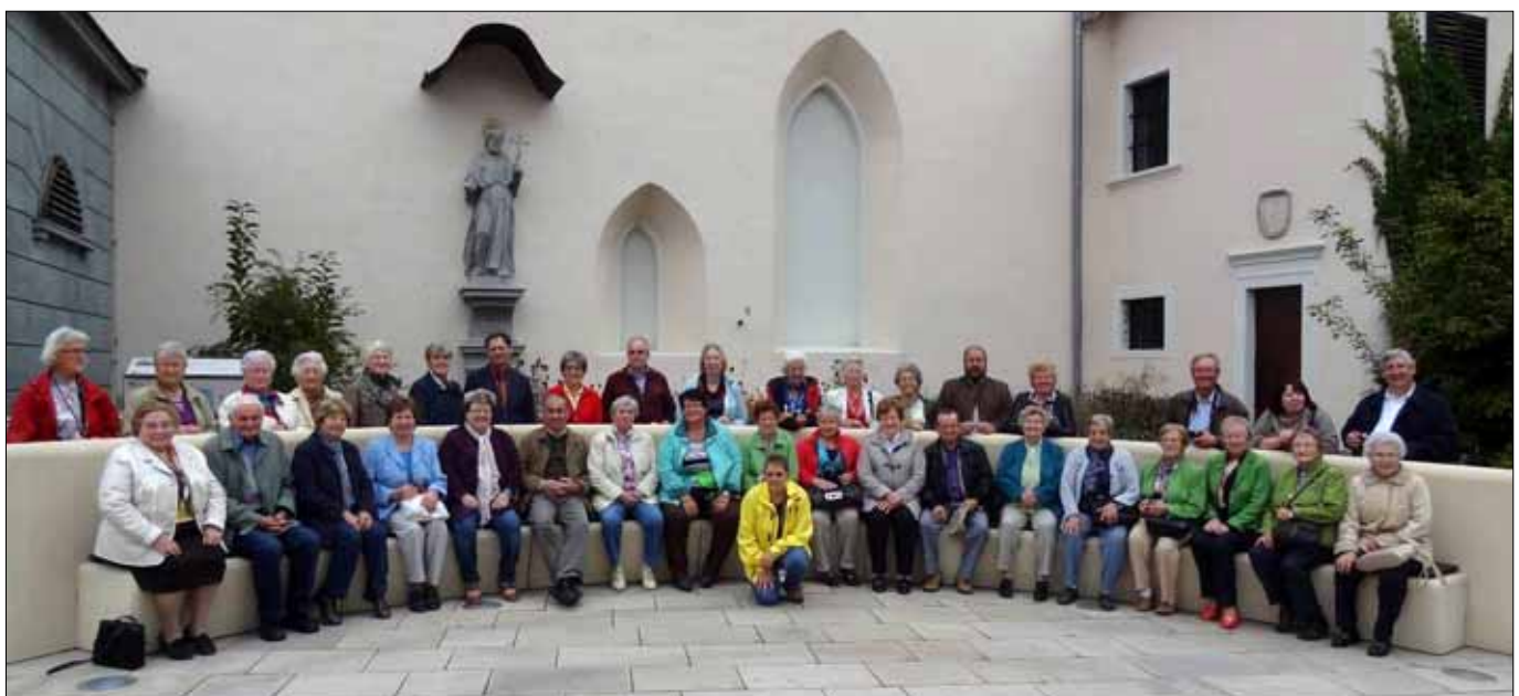
Strahlende Gesichter gab es bei der 3-tägigen Burgenlandreise der Pfarre - im Bild vor der Pfarrkirche in Güssing