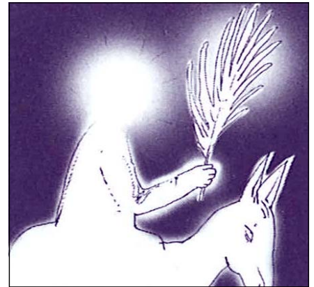
Einzug Jesu in Jerusalem